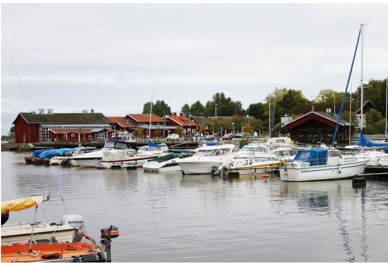
Södra Hamnplan. ("Marinan"-området)