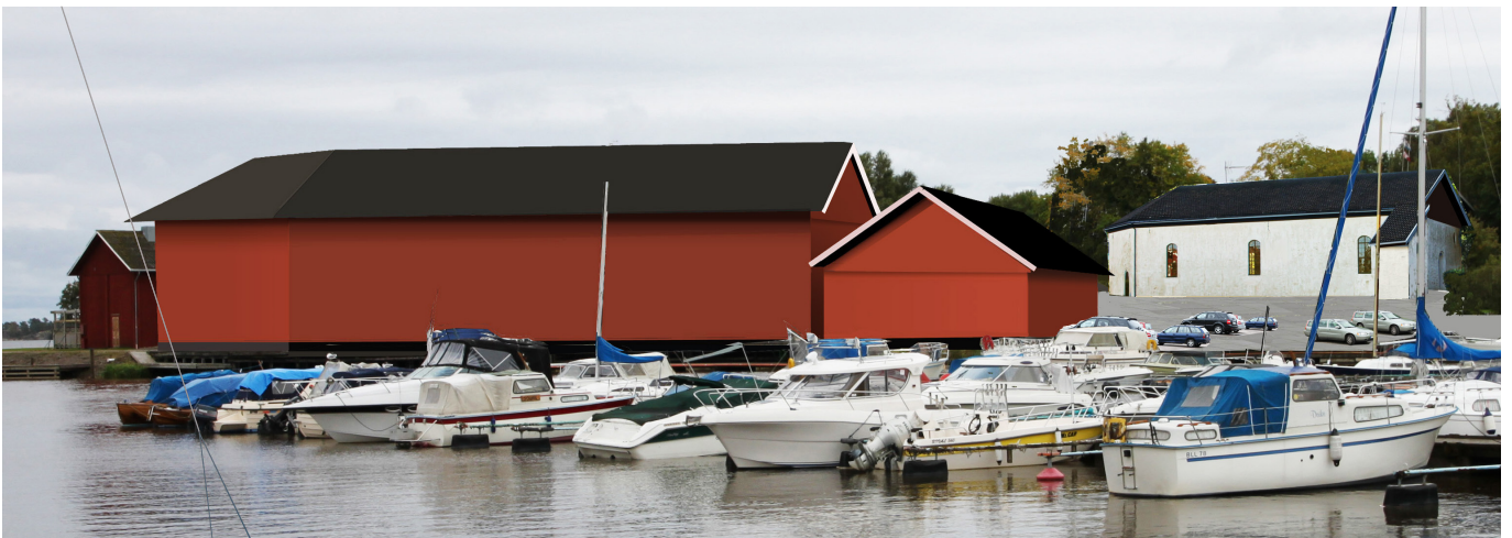
Södra Hamnplan. ("Marinan"-området)

Eftersom jag inte vet hur fönster och dörrar ser ut eller är placerade är de inte inritade. Något bättre kommer det säkert att se ut när dessa finns på plats.